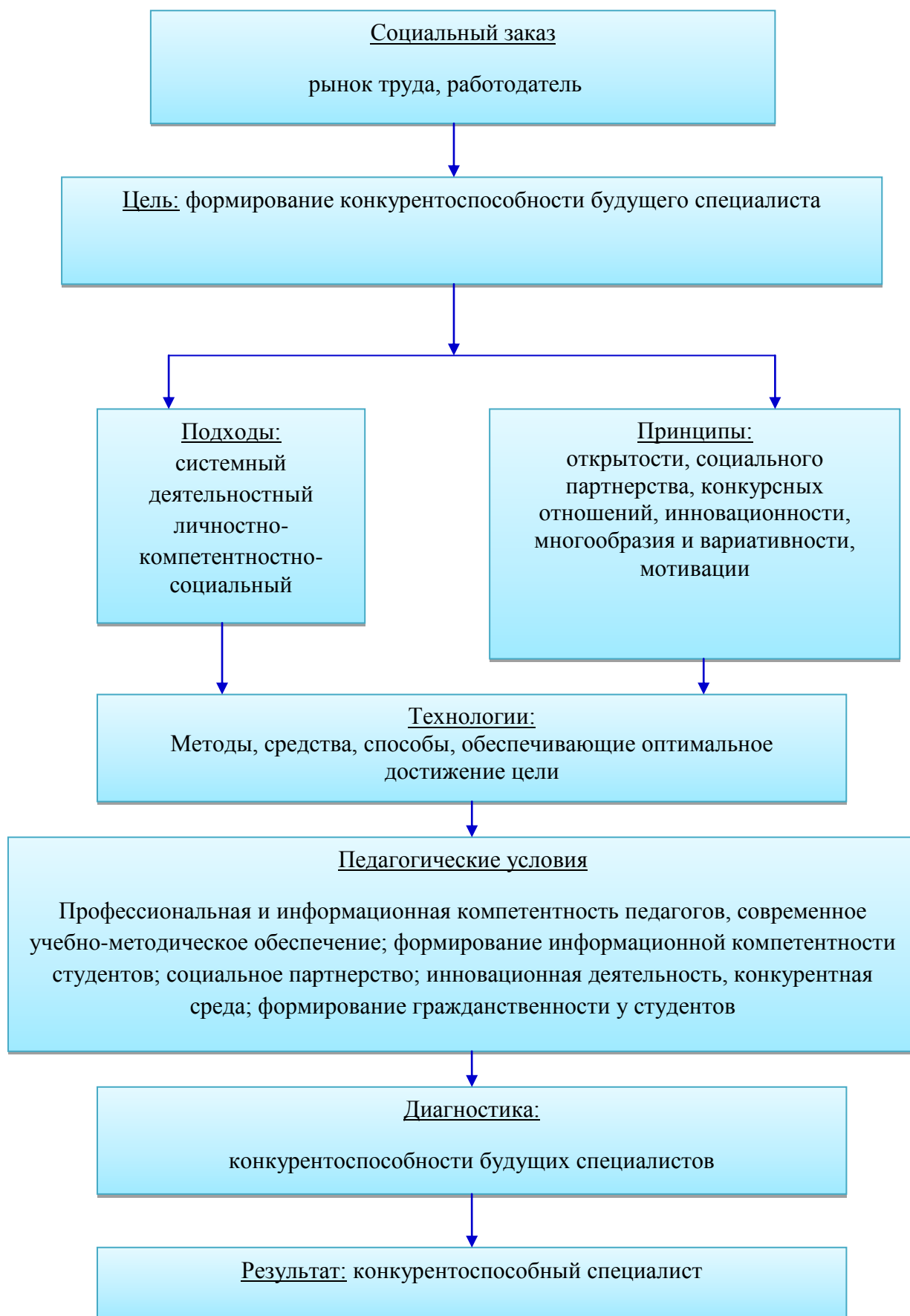
Рисунок 1 – Модель формирования конкурентоспособного специалиста.